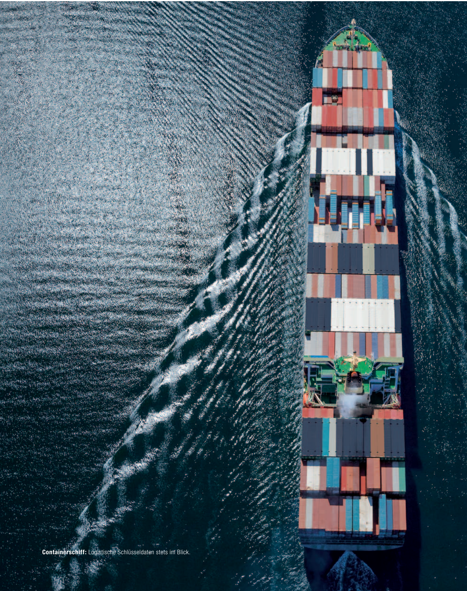
Containershipf: Logistische Schlüsseldaten stets im Blick.